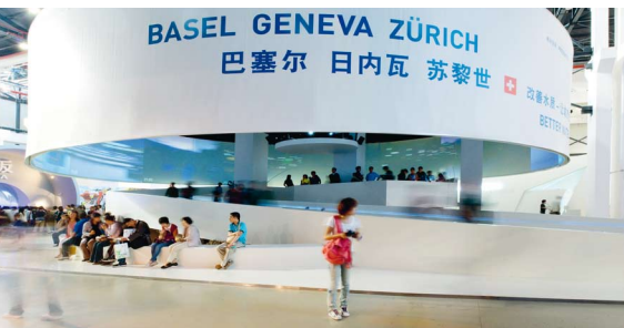
2010年上海世博会上巴塞尔、日内瓦以及苏黎世的联合城市展馆。

巴塞尔参加上海2010年世博会是巴塞尔—上海友好城市关系的示范项目。以《改善水质，让城市生活更美好》为主题，巴塞尔、日内瓦和苏黎世的联合城市展馆从2010年5月初到10月底向两百万观众展示了一个主题：投入财力进行可持续性水资源管理是如何极大地提升了城市生活的质量。