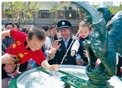
2009年4月在上海蝴蝶湾亲水公园巴塞尔龙喷泉落成典礼。