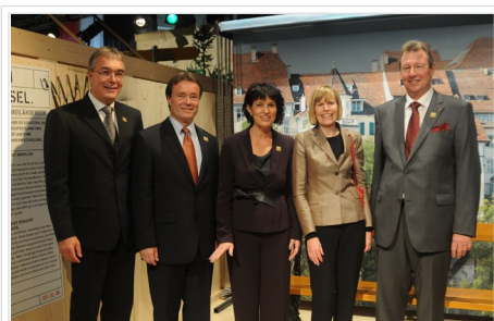
VIP-Besuch durch Bundespräsidentin Doris Leuthard und die Regierungsvertreter der Gastkantone.