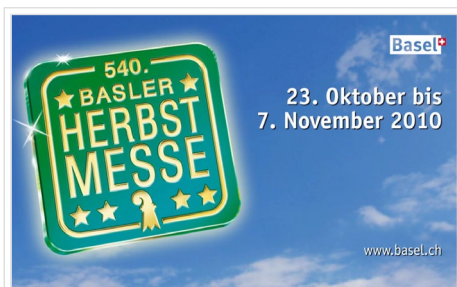
Basler Herbstmesse auf SF1, SF2 und Telebasel.

dies war an der 540. Basler Herbstmesse gewährleistet: Auf dem Petersplatz wurde in der Bernoullistrasse der Hääfelimäärt aufgewertet und durch verschiedene Aktionen wieder in das Gedächtnis der Besucherinnen und Besucher zurückgeholt (siehe Interview unten). Resultat war, dass die Herbstmesse-Gäste die Bernoullistrasse wieder vermehrt besucht haben. Auch auf den Plätzen der Schaumesse konnten mit Attraktionen wie der neuen Riesenschaukel «Monster» und dem höchsten Kettenkarussell der Welt die Besucherinnen und Besucher begeistert werden.