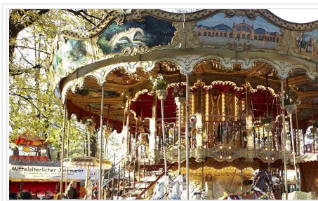
Das nostalgische Doppelstock-Karussell auf dem Petersplatz.

Die Abteilung Aussenbeziehungen und Standortmarketing schaut auf eine erfolgreiche Basler Herbstmesse 2010 zurück, die von einem hohen Publikumsaufkommen und trockenem Wetter geprägt war.