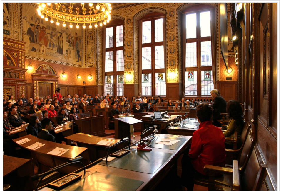
Chinesisches Mondfest am 22. September 2010: Empfang von rund 200 Chinesinnen und Chinesen im Basler Rathaus.