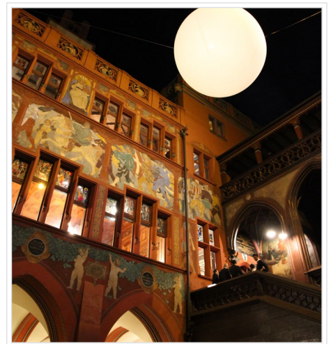
Der traditionelle Mond-Ballon durfte am Rathaus Himmel nicht fehlen.