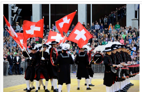
Highlight des Arenaprogramms ist die beliebte Basler Formation Top Secret.