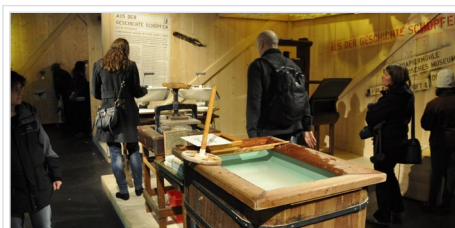
Die Sonderschau der Gastkantone beinhaltet viele interaktive Elemente – so z.B. eine Papierpresse des Basler Papiermuseums.