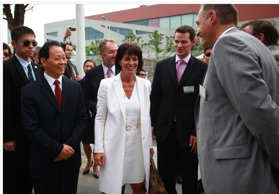
Besuch der Bundespräsidentin Doris Leuthard am Schweizer Tag an der World Expo 2010 Shanghai.

Das Standortmarketing zieht eine positive Bilanz zum Basler Auftritt an der World Expo 2010 Shanghai, welche am 31. Oktober ihre Tore schloss. Im Anschluss sollen Basels Städtepartnerschaft mit Shanghai sowie die Beziehungspflege zur chinesischen Gemeinschaft in Basel intensiviert werden.