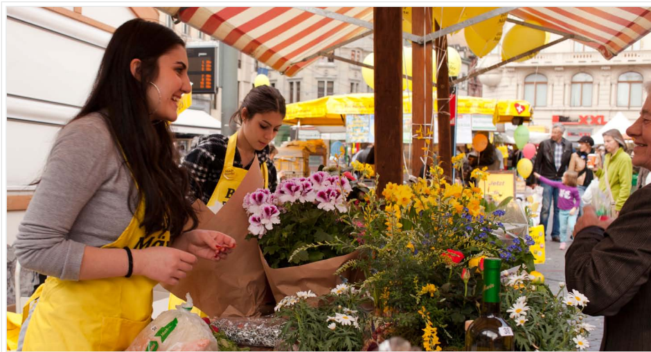
Gelb ist die Farbe des visuellen Auftritts des «Tages der Basler Märkte».

Am «Tag der Basler Märkte», der dieses Jahr zum ersten Mal stattfand und die Marktsaison einläutete, präsentierten sich die Stadt- und Quartiersmärkte von ihrer schönsten Seite. Die Zusammenarbeit der Beteiligten hat sehr gut geklappt, und auch das Wetter spielte mit.