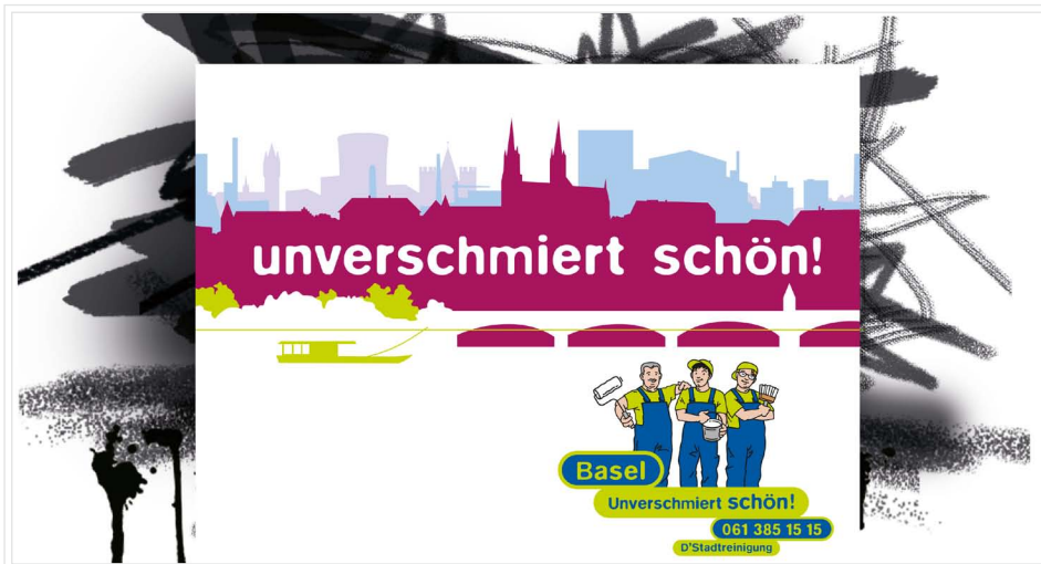
Die neue Kampagne gegen Verschmierungen im öffentlichen Raum.