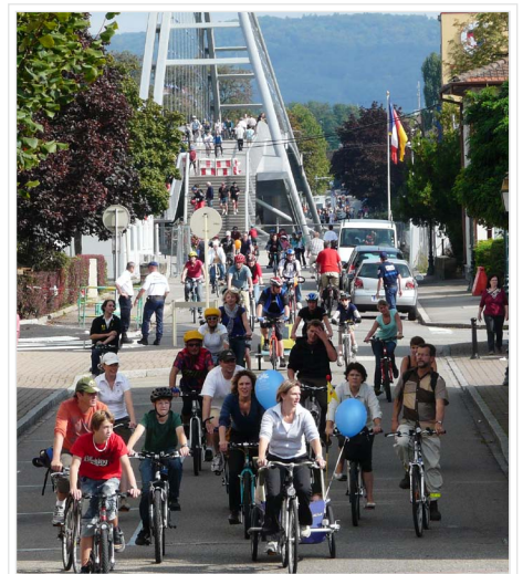
Gemeinsam unterwegs am slowUp Dreiland.