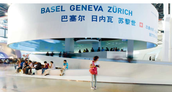
Der Städtepavillon von Basel, Genf und Zürich an der World Expo 2010 in Shanghai.

Basels Auftritt an der World Expo 2010 Shanghai ist das Leuchtturmprojekt der Städtepartnerschaft Basel-Shanghai. Unter dem Motto «Better Water – Best Urban Life» zeigte der gemeinsame Städtepavillon von Basel, Genf und Zürich von Anfang Mai bis Ende Oktober 2010 über zwei Millionen Besucherinnen und Besuchern auf, welchen Beitrag Investitionen in ein nachhaltiges Wassermanagement für eine ausserordentlich hohe urbane Lebensqualität leisten.