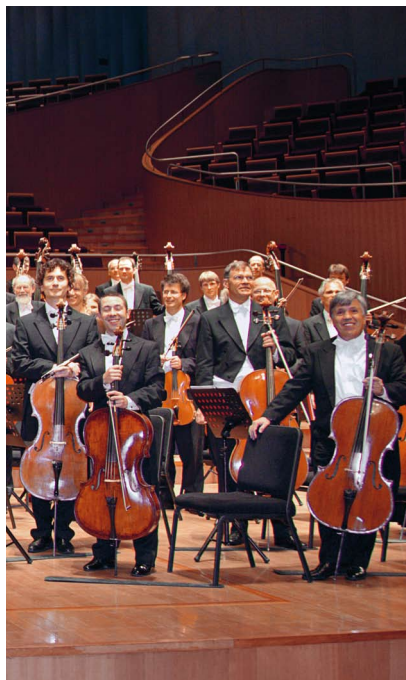
Konzert des Basler Sinfonieorchesters am 11. August 2010 im Shanghai Oriental Art Center.