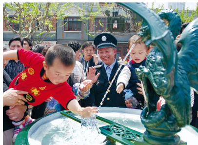
Einweihung eines Basler Basilikenbrunnens im Shanghaiier Butterfly Bay Park im April 2009.